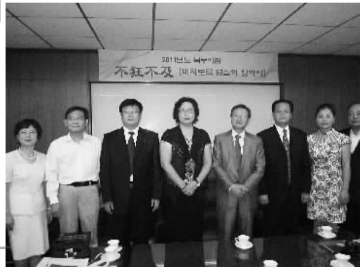
▲池州市旅游促销团拜访韩国观光协会中央会首尔特别观光协会。