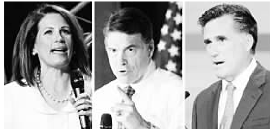
众议员米歇尔·巴克曼(左)、现任得克萨斯州州长佩里(中)和前马萨诸塞州州长罗姆尼(右),在美国共和党的总统候选人提名战中呈现三强鼎立的态势。