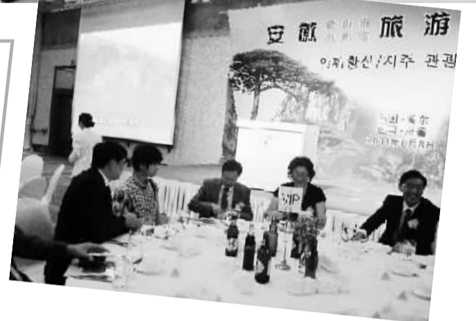
▲池州市旅游促销团在首尔举行的旅游产品说明会上推介。