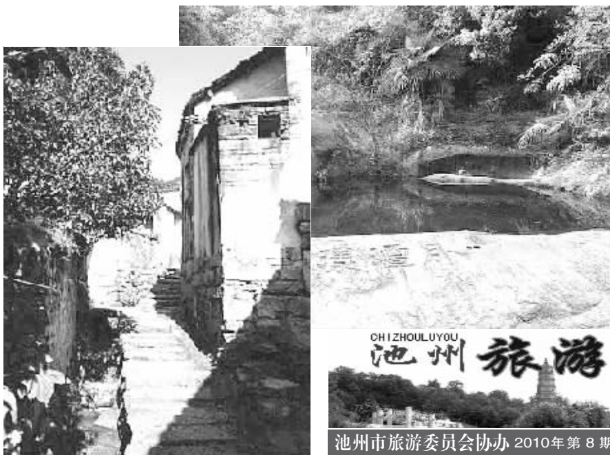
池州市旅游委员会协办 2010年第8期

千年古村石门高因出任官宦达百余人而闻名，唐代“魁”字巨型石刻、村庄布局、水口等无不体现古村落“魁”文化的神秘。李白游此写下“妙有分二气，灵山开九华”，改九子山名为九华山，金地藏途经石门，亦称此“仙山山水仙境”。目前由池州石门高旅游开发公司投资5000万元打造的乡村旅游示范区、中国神秘“魁”文化村旅游项目建设正有条不紊进行，计划于今年底对游客试开放。