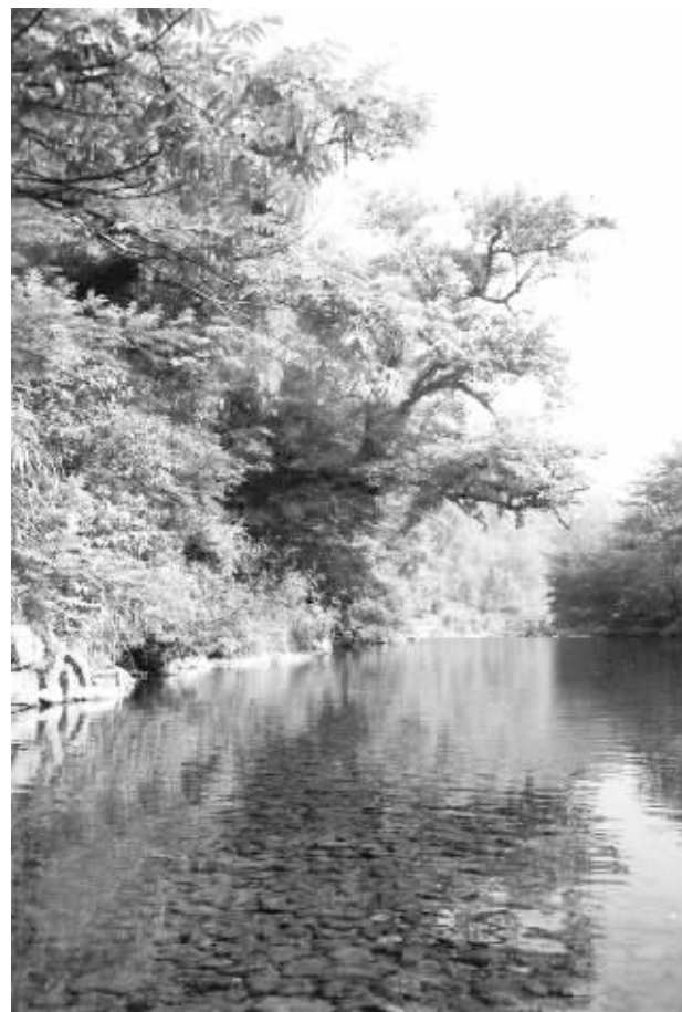
白筭坡前清悠的龙舒河。